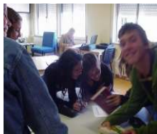
Alunos do 7º ano participando no peddy-paper

numa visita guiada. Explicámos como funcionava a biblioteca, como se deve procurar um livro ou outro tipo de material e a seguir convidámos os alunos a realizar um Peddy-Paper. Também, em colaboração com os professores de TIC, aproveitámos o tema e realizámos durante a semana um Peddy-Paper