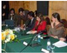
Assinatura do Protocolo